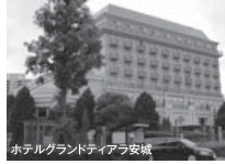
ホテルグランドティアラ安城

■ 期 日……………平成29年9月3日(日) 受付:午後2時30分～ 総会:午後3時00分 同期会:午後3時30分～