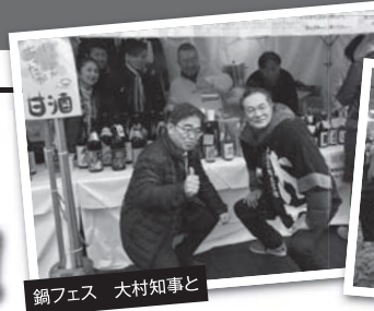
鍋フェス 大村知事と