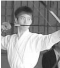
詳細は7ページにて