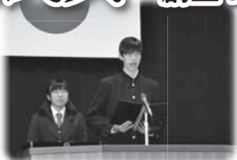
生徒代表誓いの言葉 (生徒会役員)