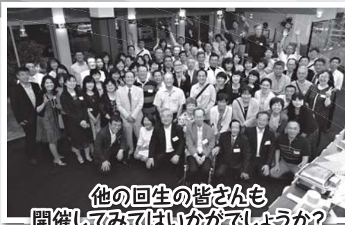
他の回生の皆さんも 開催してみたいか? はいかがでしょうか?