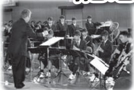
式典開幕 吹奏楽部の演奏

母校安城東高等学校は40周年を迎え、東高体育館にて、創立40周年記念式典が盛大かつ厳かに挙行されました。