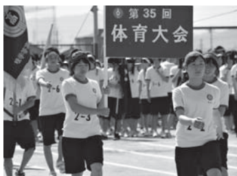
▲入場行進先頭 生徒会長