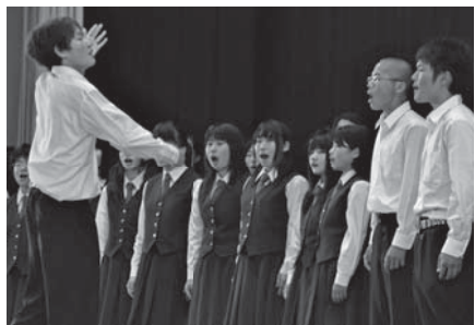
▲合唱コンクール優勝 赤団